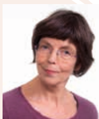
Ida Bull NTNU