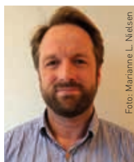
Arnfinn Stendal Rokne Vitensenteret